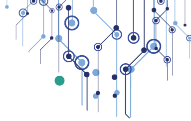
Table des matières